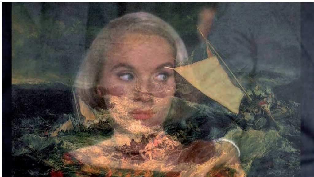
9. Portrait à Hélice – Portrait with a Fly , 2006

in Francia, Portogallo, Norvegia, Finlandia, Canada e Brasile. Molte di queste curate da Brigitte Négrier della Galerie La Ferronnerie, che lo rappresenta. Fiévet espone per la prima volta in Italia.