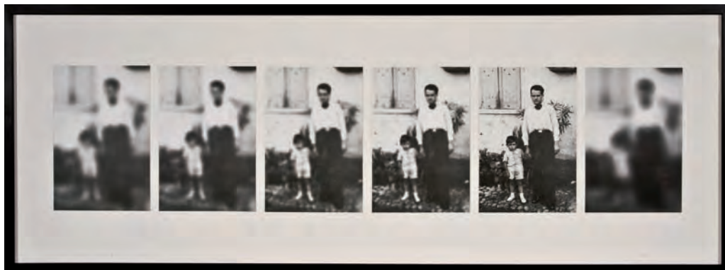
38. Studio per Memoria Evocativa – Infanzia, 1972

Galleria Christian Stein di Torino e alla Bertesca di Genova, alla Galleria del Naviglio, al Museum am Ostwall di Dortmund e alla Galleria L'Uomo e L'Arte di Milano. Nel 2001 tiene un'antologica alla Fondazione Bandera di Busto Arsizio curata da Alberto Fiz e Vittorio Fagone. Nel 2002 partecipa alla mostra "Utopie Quotidiane" al PAC di Milano.