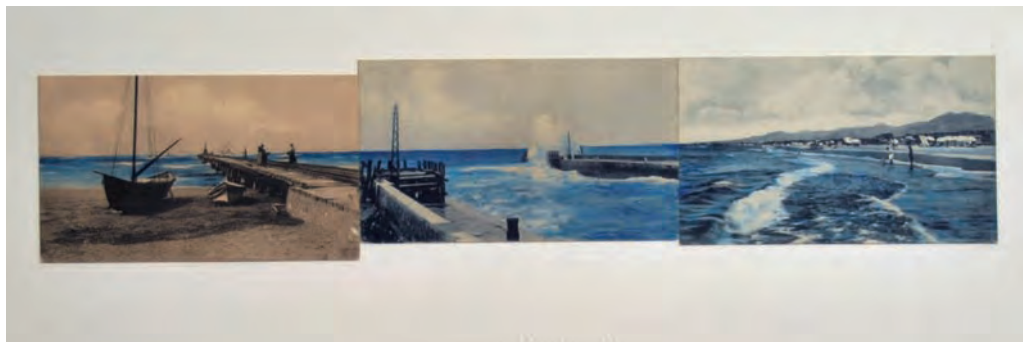
22. Terra incognita #2 , 2009

Recentemente ha tenuto personali in vari musei e gallerie del Brasile, Germania, Portogallo e Italia, a Milano, alla Galleria Riccardo Crespi. Vive e lavora a Campinas, Brasile.