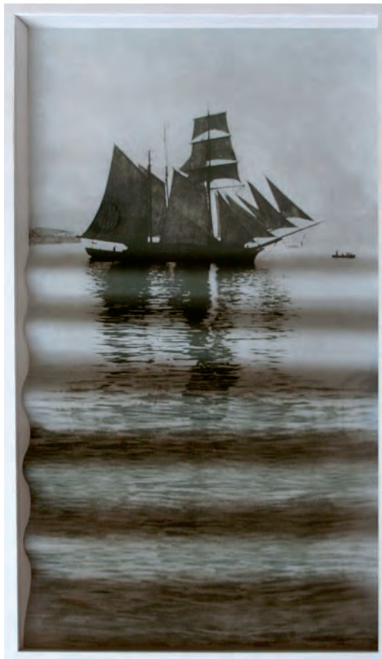
39. Onda , 2006

Espone in mostre personali a partire dal 2001 in Italia e al National Museum di Zara, dove è stata insignita del primo premio all'XI Salone dei Giovani Artisti. Ha partecipato a mostre collettive in Italia, negli Stati Uniti e in Germania.