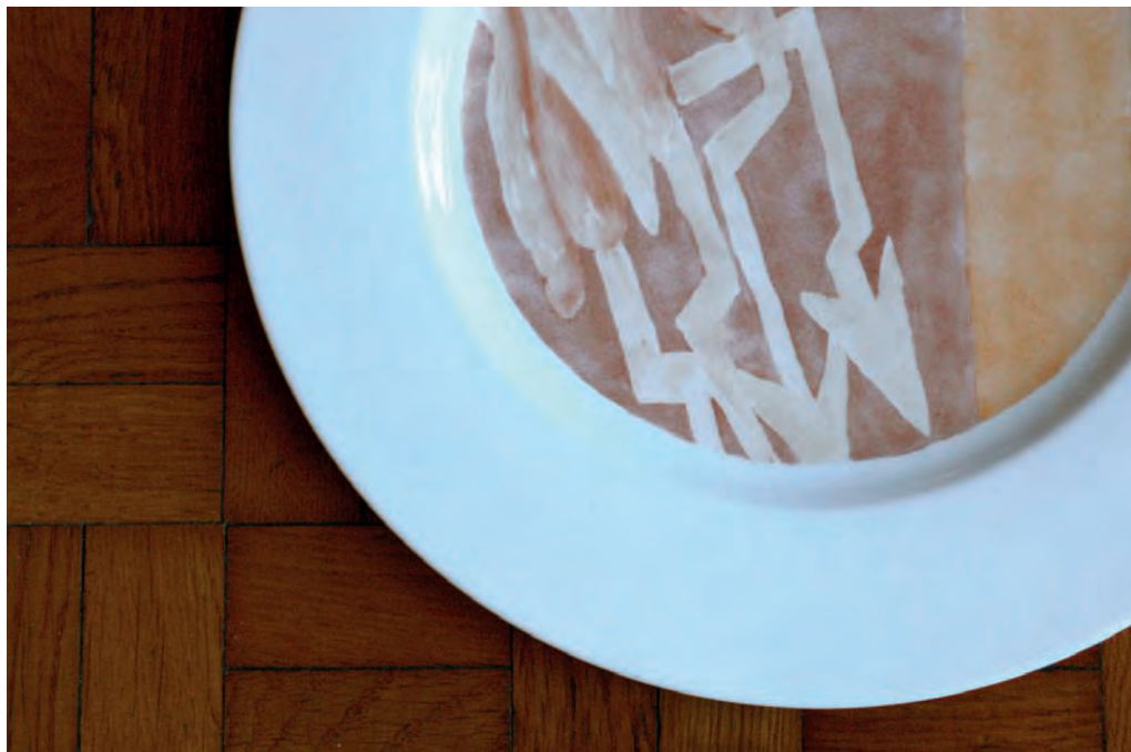
14. Ora è il tempo di sempre (dettaglio), 2011

di Prodotti Audiovisivi. Utilizza media e linguaggi differenti, in relazione alle storie di volta in volta raccontate. Ha tenuto personali a Torino e Berlino e partecipato a collettive in Italia, Germania e Irlanda.