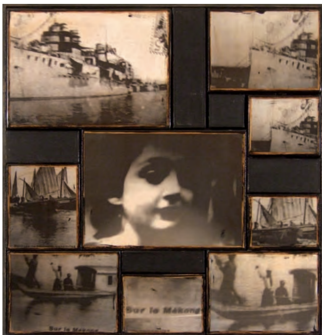
31. Le Mékong , 2007

Italia e in Francia. Dal 2002 partecipa a collettive sia in Musei che in gallerie private italiane e francesi.