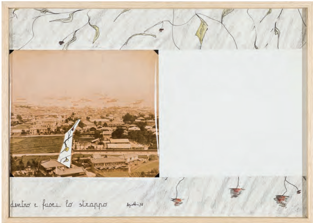
1. Dentro e fuori lo strappo , 1978

Ha tenuto mostre personali e partecipato a collettive in Musei e Gallerie private in Europa, Nord e Sud America e Israele.