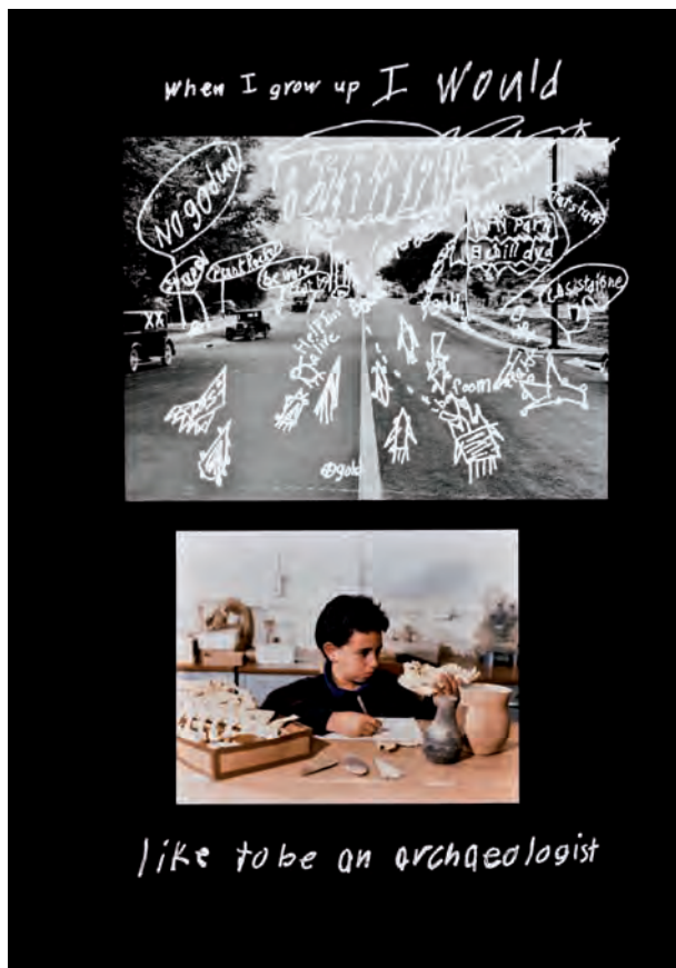
42. Archeologist , 1990

Dal 1971 ha esposto in diverse gallerie e musei in Italia, Europa, Stati Uniti, Messico e Canada.