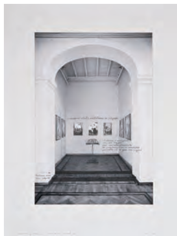
37. Progetto per Memoria Variabile 1973

“La memoria, assimilazione di esperienze, è ovviamente variabile. Variabile in funzione delle sollecitazioni evocative, a seconda delle proprie esperienze; e le stesse sono variabili nel tempo a seconda delle modificazioni subite dall'io”.