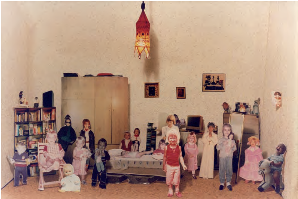
30. Loc. Collecchio 26 , 2001

fotografia Riccardo Pezza a Milano e nel 2006 tiene una personale curata da Emanuela De Cecco alla Galleria Artopia. Ha partecipato a mostre internazionali collettive a partire dal 2001 in Italia e in Europa.