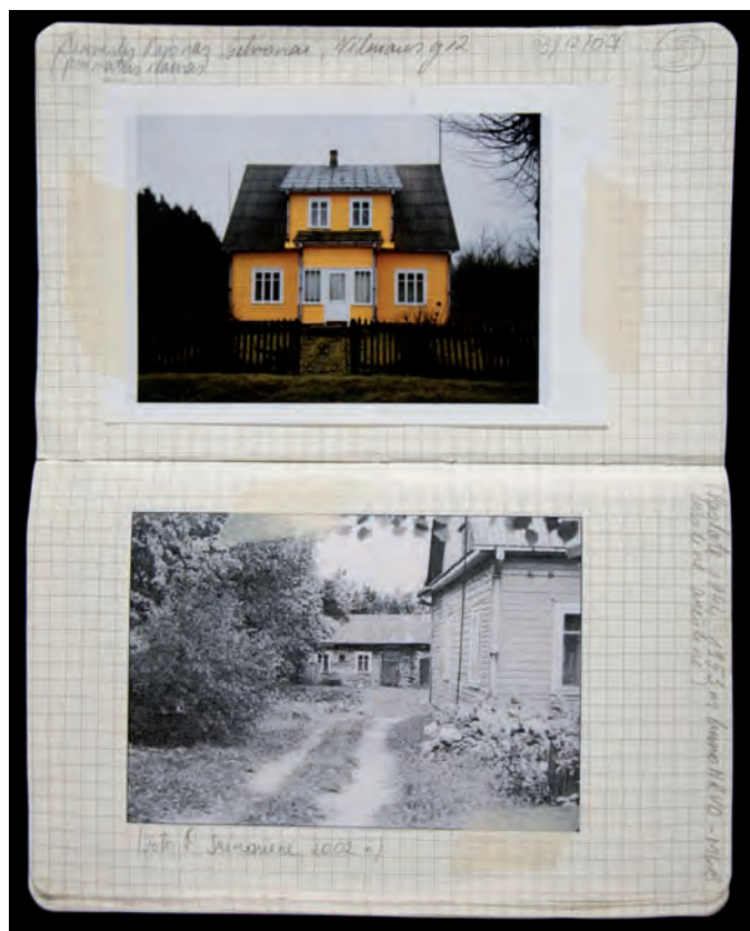
34. (1944 -1991) Notebook, 2008

partecipato a premi e mostre collettive in Enti Pubblici e gallerie private in Inghilterra, Francia, Scozia, Austria, Cracovia e negli Stati Uniti. A Milano la Galleria Camera le ha dedicato una personale.