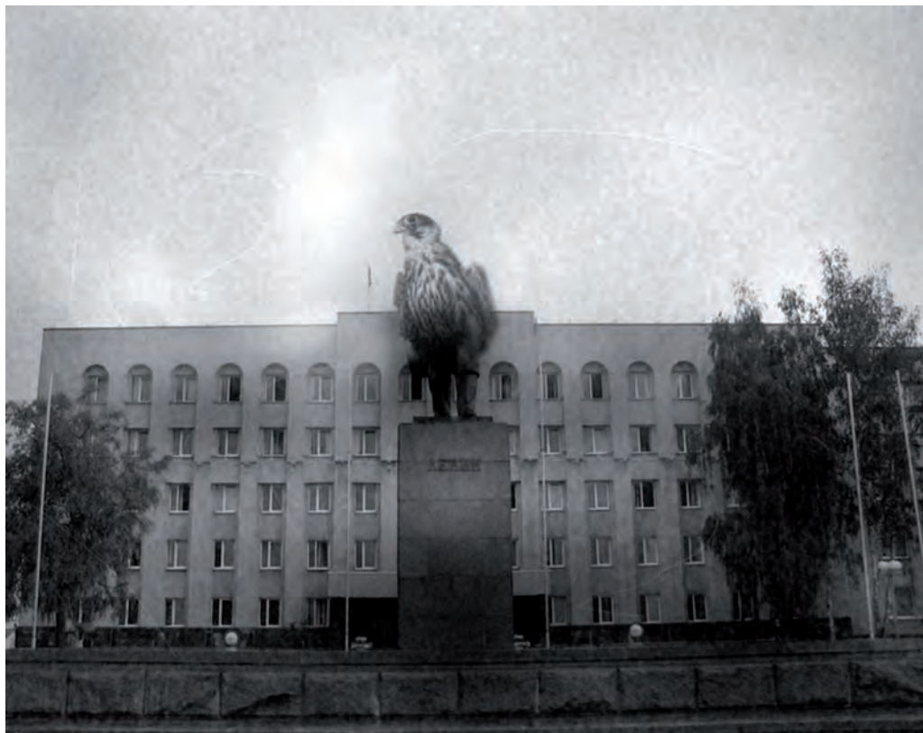
26. The lost architect , 2009

cinema al teatro e all'architettura. Per Pitin l'architettura non è uno sfondo, un ambiente in cui l'essere umano si muove, ma parte dell'essere umano stesso.