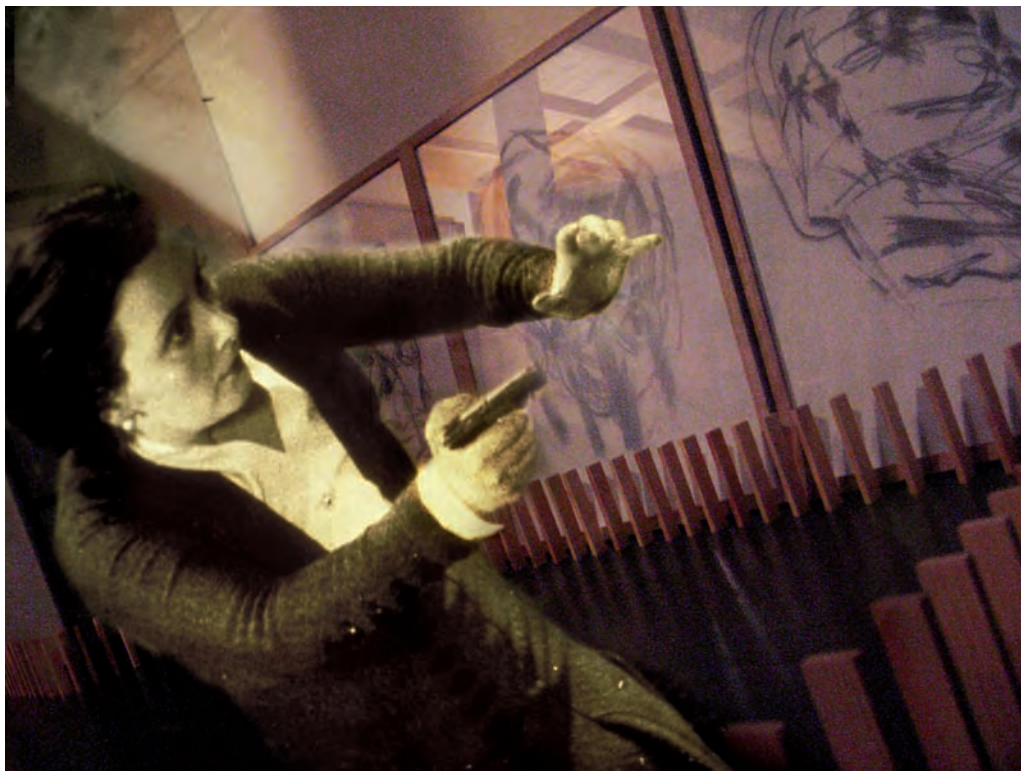
33. Prise , 2008

alla Maison Européenne de la Photographie, ai Fonds National d'Art Contemporain (Parigi), al Houston Fine Arts Museum, al Los Angeles Country Museum (USA), al Musée National d'Art Moderne, Centre Pompidou (Parigi).