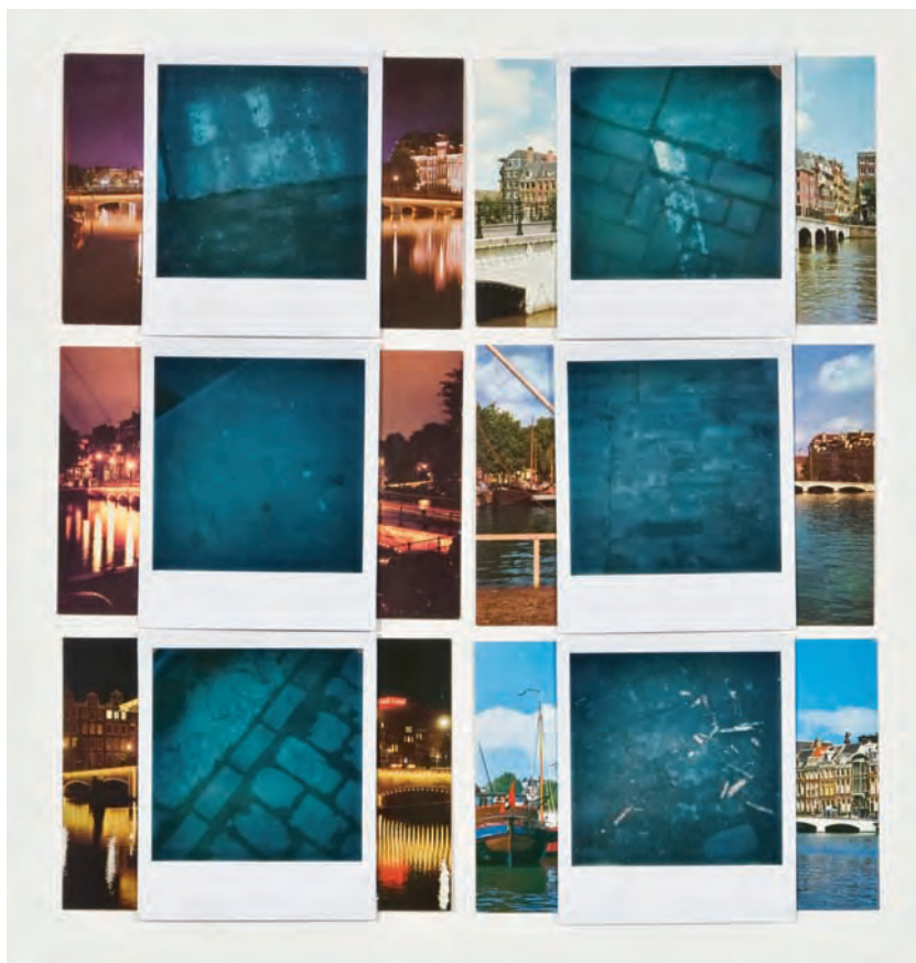
25. Amsterdam, Magere Brug, 1974/76

apre uno studio fotografico, realizza campagne pubblicitarie, servizi di moda e costume mentre continua il lavoro in campo musicale componendo musica e creando installazioni e performance. Ha esposto in Germania, Svizzera, Stati Uniti e Olanda, dove nel 1984 ottiene il Primo Premio Polaroid per i trittici di grande formato.