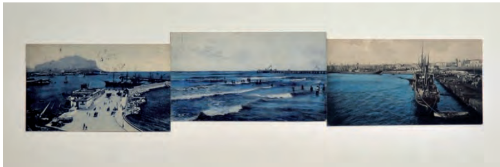
23. Terra incognita #4 , 2009

Moscheta usa materiali semplici e comuni e li trasforma per creare opere molto poetiche. Con polvere di grafite simula immagini fotografiche, con pezzi di cotone le nuvole, i sassolini diventano montagne, i cubetti di ghiaccio giganteschi iceberg. Con tutti questi, ma anche con semplici cartoline e fotografie esplora i concetti di tempo, di spazio e il rapporto dell'essere umano con il paesaggio che lo circonda.