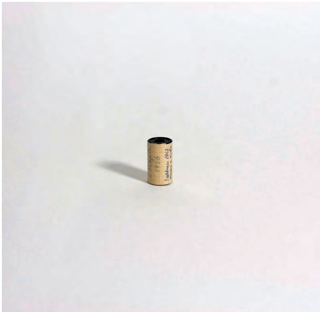
6. Feb. 1957 – Mamma a scuola , 2010

ha tenuto mostre personali a Milano alla Galleria Artopia, a Firenze e a Siena e, dal 2003, ha partecipato a premi e a mostre collettive in Francia, Germania, Grecia, Giappone e Repubblica Ceca.