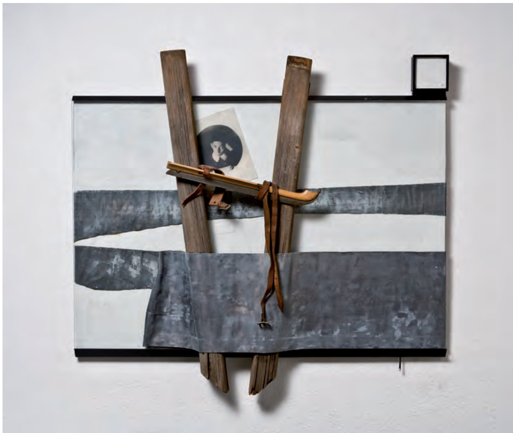
21. Il rifiuto del legno di Pinocchio , 1990

retrospective del suo lavoro alla Galleria Nazionale d'Arte Moderna di Roma, alla Kunsthalle di Klagenfurt e a Le Fresnoy a Lille. L'attività artistica di Mauri comprende teatro, performance, installazioni, pittura e teoria. Muore a Roma il 19 maggio del 2009.