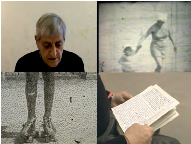
3. Ars Memoriae – altre tracce , 2009

Negli anni Sessanta realizza molte operazioni, azioni, eventi e libri. Da allora Baruchello ha prodotto molti video che si trovano nelle videoteche di tutto il mondo e ha esposto pitture, assemblaggi e sculture in musei, fondazioni e gallerie private.