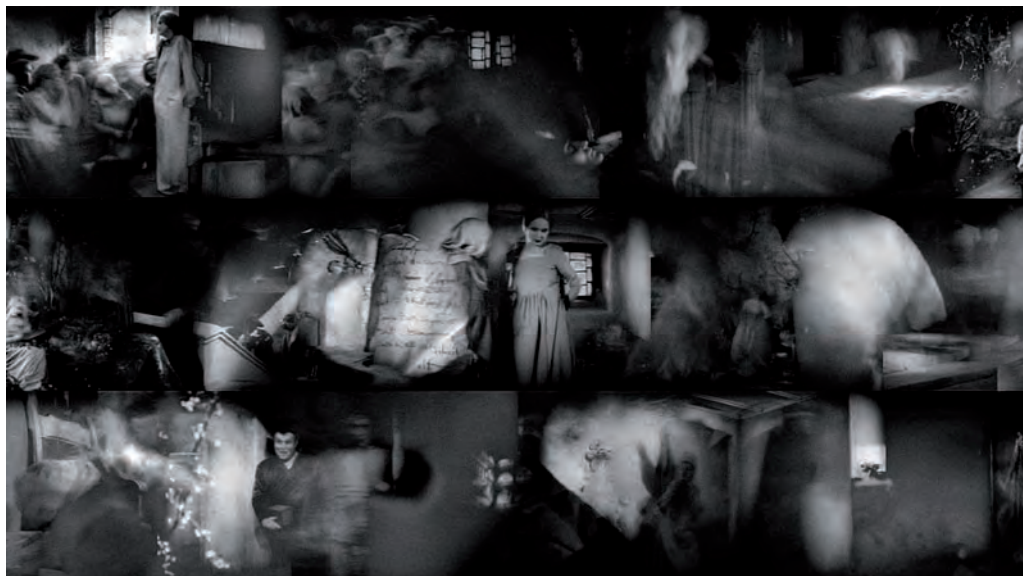
29. Faust golden vivisection , 2009

Da allora si è dedicato al video. I suoi lavori, le sue installazioni video e performance sono stati esposti alla Biennale di Venezia, al Guggenheim di Bilbao, al Moca di Montreal e al Los Angeles Museum of Contemporary Art. Ha ricevuto la Arts Fellowship Grant dalla Rockefeller Foundation e il 1° premio alla Transmediale International Art Festival di Berlino.