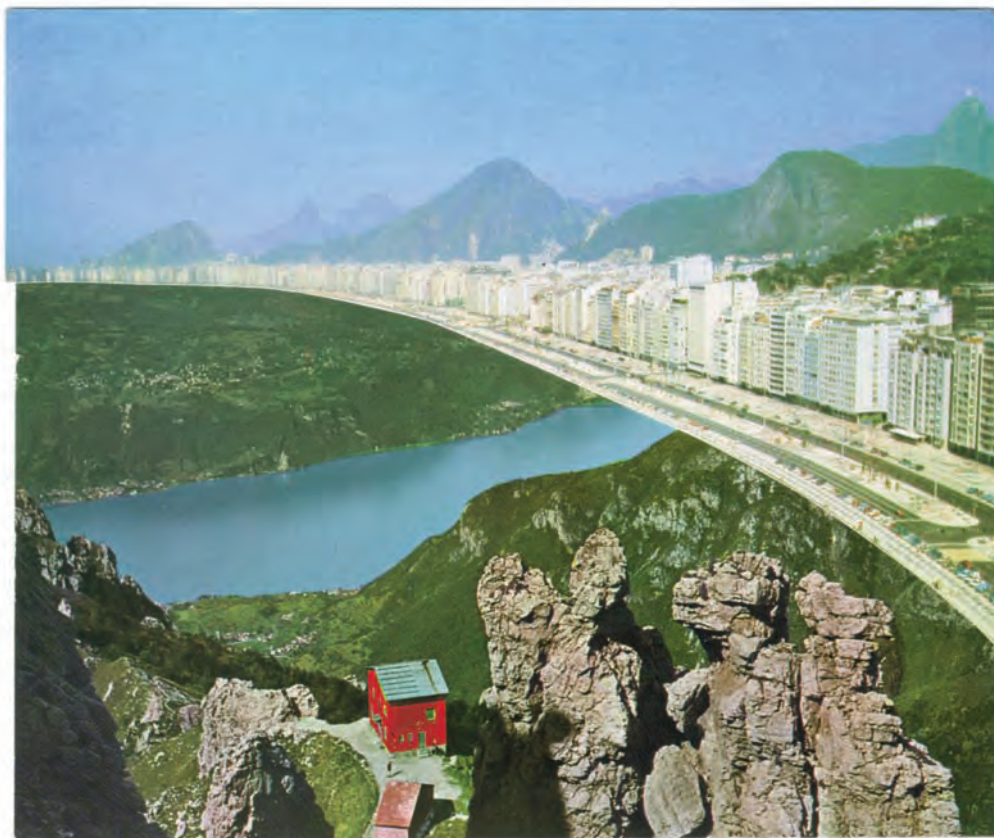
35. Utopic memory landscape 063 , 2010

Pubblici in Italia, Romania e Slovenia. Nel 2009 realizza la sua prima personale a Genova e, nell'anno seguente, è stato fra i finalisti del Sovereign Art Price di Londra.