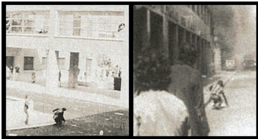
41. Cronaca di un giorno perfetto , 2010

Spettacolo. Nel 2008 segue il Corso Superiore di Arti Visive alla Fondazione Ratti. Tiene mostre personali in Italia a partire dal 2006.