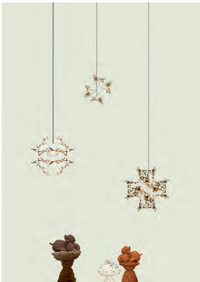
4. Three stars and three ovaries separating in space , 2011 (disegno preparatorio)

primo allestimento al Careof in Via Farini. Da allora partecipa a collettive in molte Gallerie e Musei in Europa, Asia e America, realizza installazioni e mostre personali in Italia Spagna e Stati Uniti.