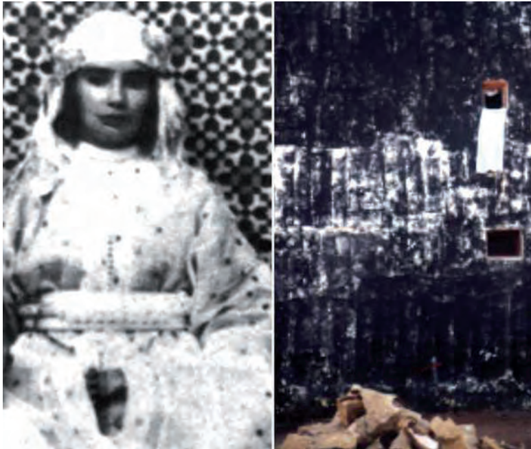
27. Sans conte ni légende n.2 , 2003

Marocco e Algeria. Dal 1986 partecipa a diverse Biennali, tra cui la Biennale Internazionale di Fotografia a Torino (1997), e a mostre collettive in Europa, Canada e Brasile.