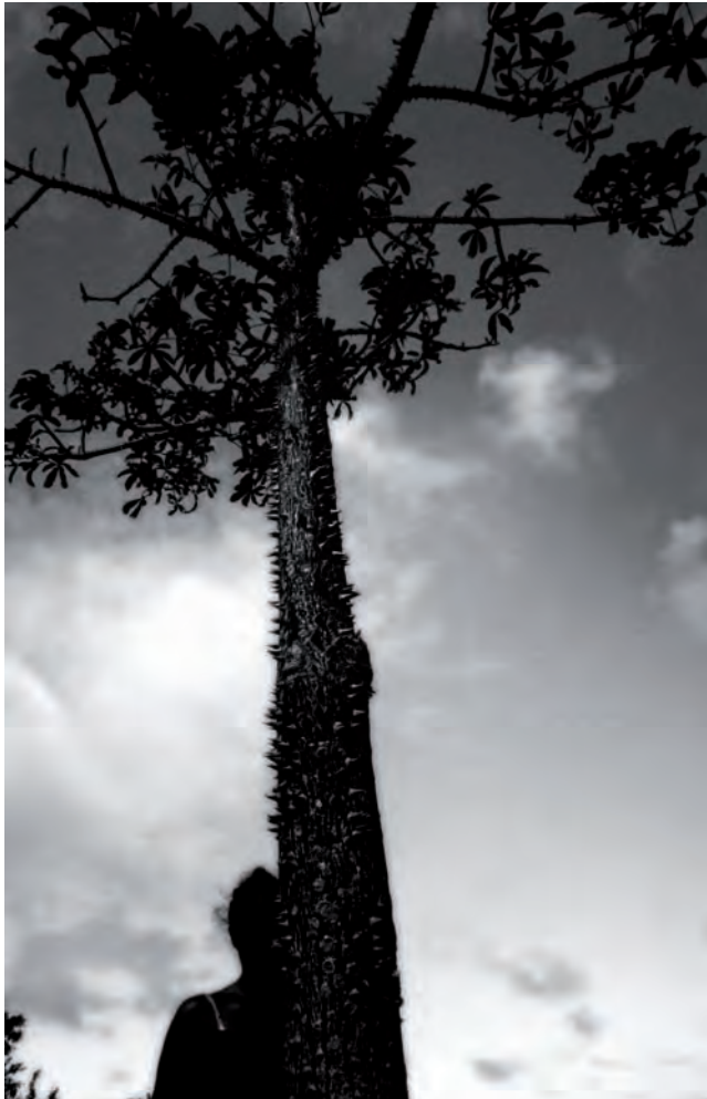
8. The focus of attention (Island) , 2010

dal 2003. Ha partecipato a mostre collettive e a film o video festival in musei e gallerie in Europa Asia e America, alla Biennale di Venezia nel 2007 e a Manifesta 7 nel 2008.