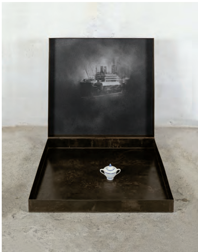
19. Zuccheriera bianca , 1998

che utilizzerà in diversi suoi lavori. Ha partecipato alla Biennale Anti-Apartheid "Living Arts" e ha vinto il 2° premio alla III Biennale Internazionale di Arte in carta (1990). Ha esposto più volte in musei e gallerie private in Europa, America, Russia e Israele. Vive e lavora tra Pietrasanta, New York e Tel Aviv.